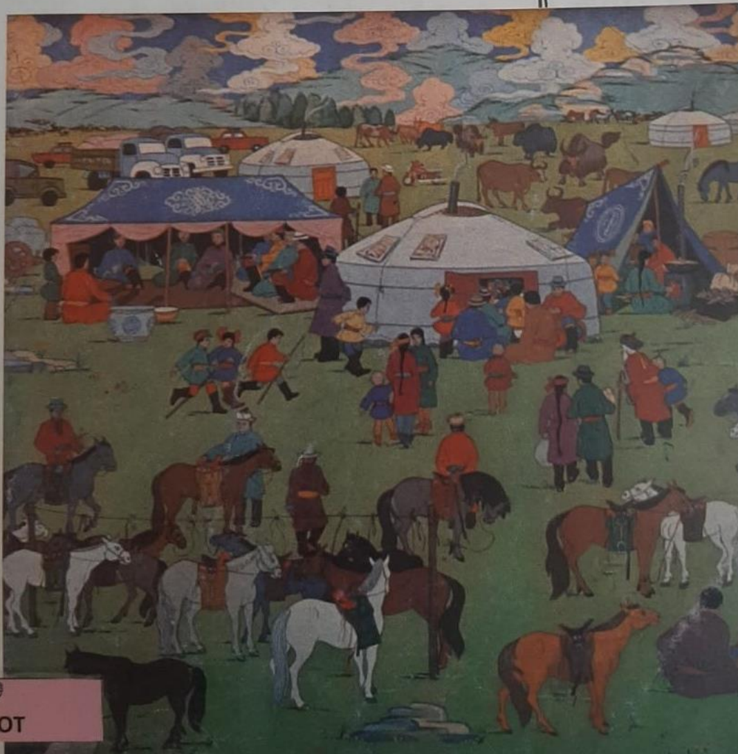
Figure 4 BUREAU PERMANENT DES ECRIVAINS AFRO-ASIATIQUES, Lotus : œuvres afro-asiatiques, n° 47/48, 1981. Bibliothèque de l'IFEAC, Bichkek, Kirghizstan.