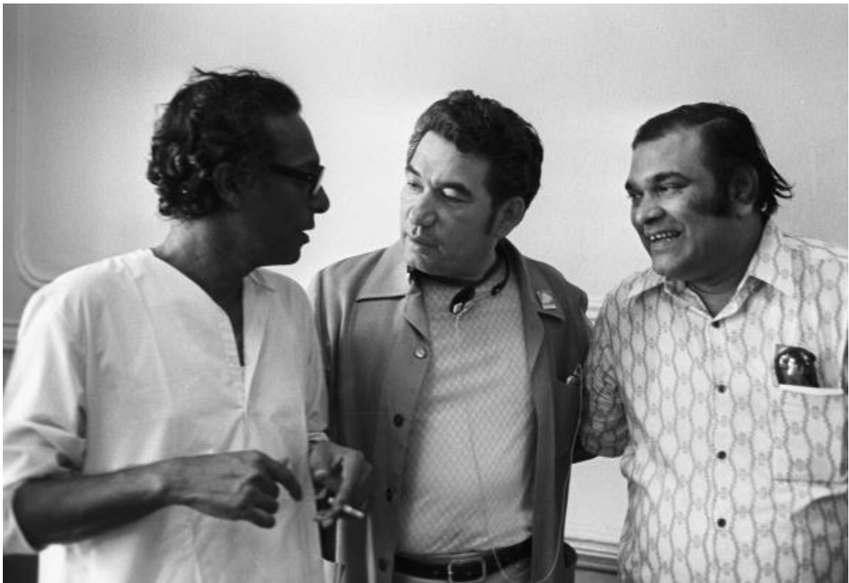
Figure 1 Troisième Festival international du film des pays d'Asie et d'Afrique à Tachkent, 1974. Tchingiuz Aïtmatov et les cinéastes indiens Mrinal Sen (à gauche) et Ramu Kariat (à droite).