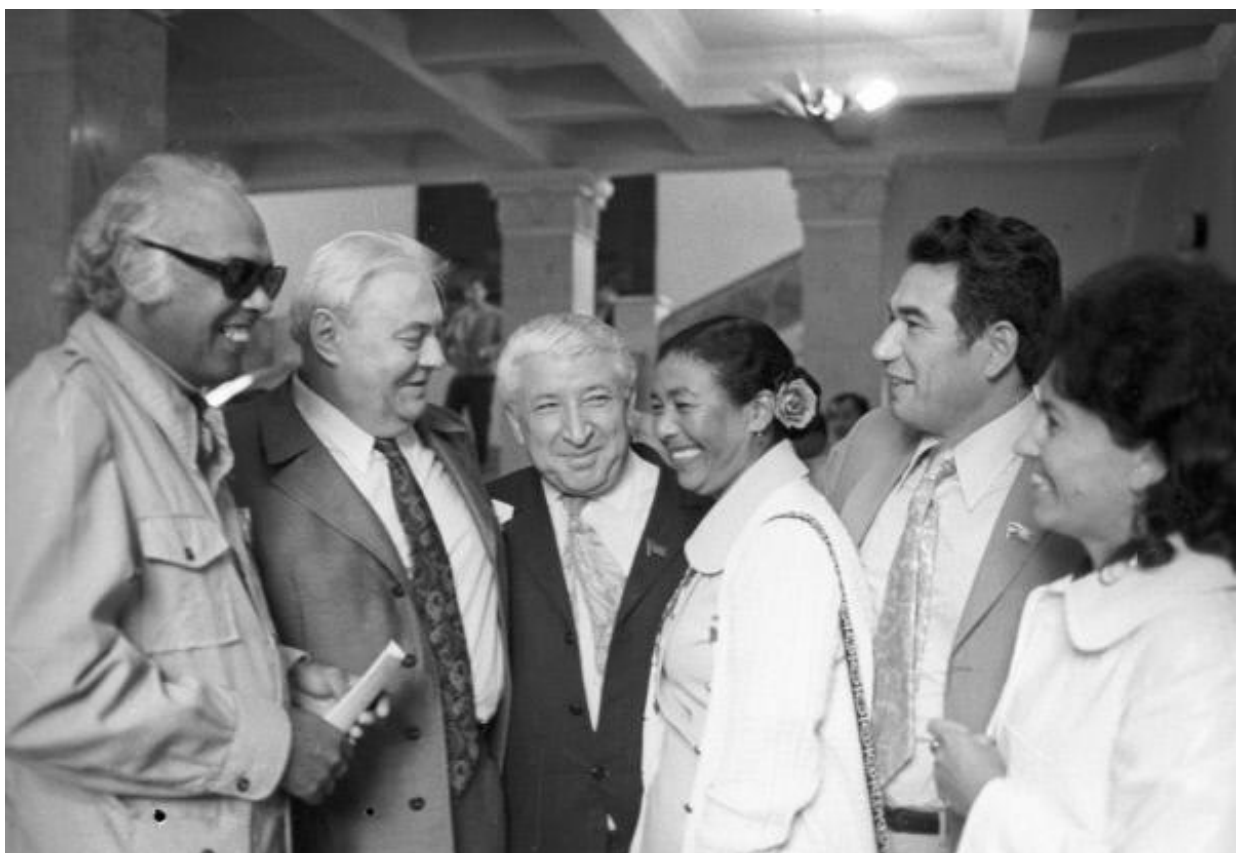
Figure 3 De gauche à droite, Alex La Guma, Anatoly Sofronov, Rasul Gamzatov et Tchinguiz Aïtmatov, lors de la 5ème conférence des écrivains afro-asiatiques à Alma Ata, Kazakhstan, 1973.