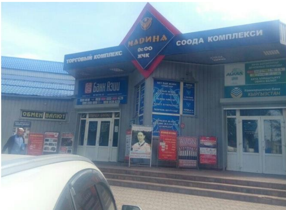
Marché de Madina à Bichkek, Kirghizstan

D'après nos enquêtes, le marché de Madina a perdu près de 60% de ses commerçants depuis le début de la nouvelle répression chinoise. Certains d'entre eux sont retournés dans leur région à la suite de la demande de la police locale (en Région ouïgoure). D'autres seraient arrêtés et expulsés par la police kirghize à la demande de la Chine. Leurs boutiques seraient ensuite récupérées par des commerçants kirghizes. Durant notre dernier séjour en Asie centrale en août 2018, le marché de Madina et un très célèbre restaurant ouïghour nommé Arzu ont subi comme on l'a dit plus haut, un nouvel incendie qui a totalement fait disparaître le restaurant en une nuit, alors qu'une partie du marché de Madina a été ravagée par la flamme la même nuit.