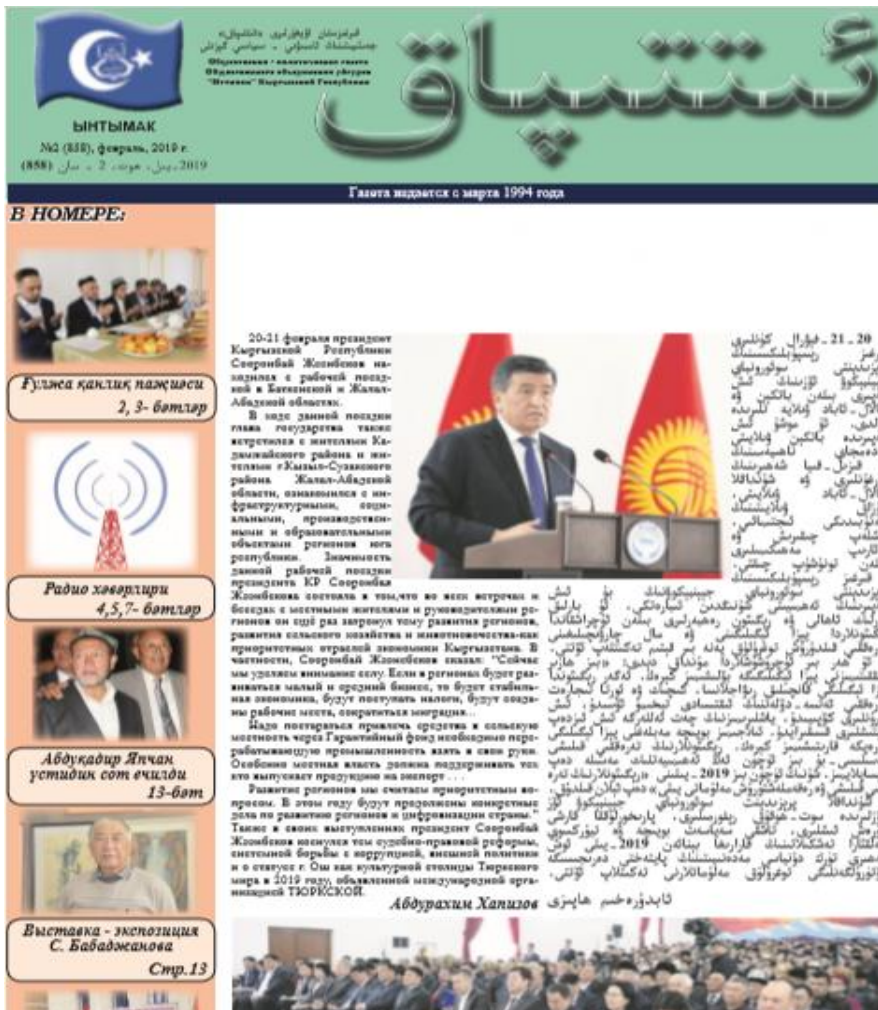
La Une de l'hebdomadaire Ittifaq (février 2019)

Au Kirghizistan, la russification de la jeunesse est plus marquante, du fait de l'absence d'école ouïghoure presque tous les enfants ouïghours sont scolarisés dans les écoles russes. Les Ouïghours du Kirghizistan sont fortement imprégnés russophones et depuis ces dernières années avec l'imposition de la langue kirghize, ils commencent à apprendre le kirghize également.