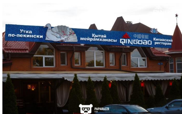
Restaurant chinois Qingdao à Almaty