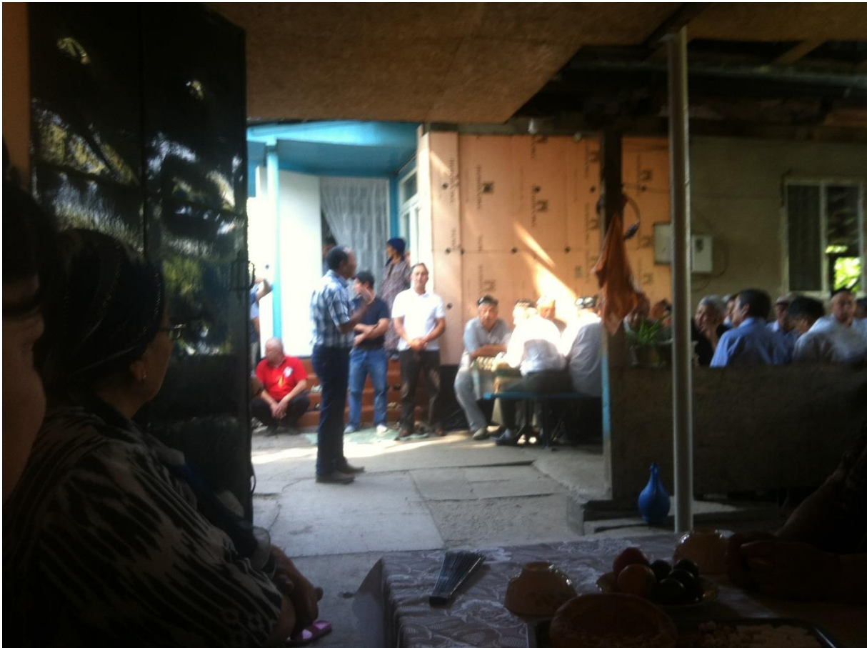
Yigit béshi s'adressant aux Ouïghours du quartier, Almaty, Kazakhstan.

ils se réunissent tous, mais c'est souvent les hommes qui prennent la parole et décident des actions à mener.