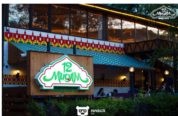
Restaurant ouïghour 12 Muqam à Almaty

Dans la très grande majorité des cas, les restaurants ouïghours n'emploient pas de salariés ouïghours que ce soit dans le service ou la gestion de la salle, sauf pour le chef de cuisine. Les Ouïghours comme au Kirghizstan, l'expliquent par le fait que d'une part, le travail de serveur ou serveuse est dur, peu rémunéré, peu gratifiant et les jeunes Ouïghours ne préfèrent en général pas ce travail. C'est encore plus vrai pour les filles pour qui le travail de serveuse est même mal vue par les familles et l'entourage. D'autre part, les restaurants ouïghours préfèrent recruter parmi le groupe ethnique dominant afin de ne pas attiser les éventuelles accusations de préférence ethnique et les ennuis que leur vaudrait de s'afficher comme purement ouïghour. Pourtant, on voit dans la ville d'Almaty des enseignes ou restaurants chinois très visibles avec des panneaux en chinois.