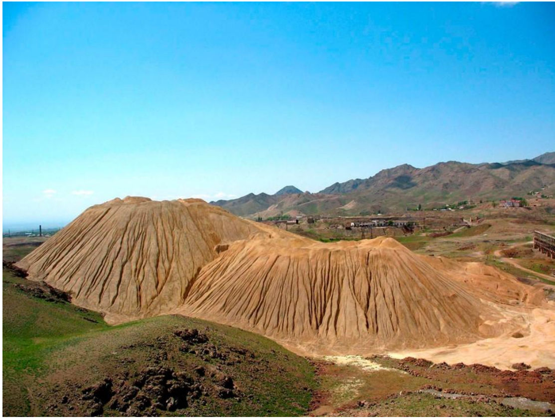
Terrils de résidus d'uranium