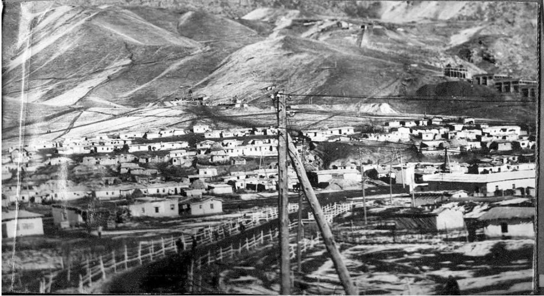
Premiers baraquements de la ville avec la mine en arrière plan