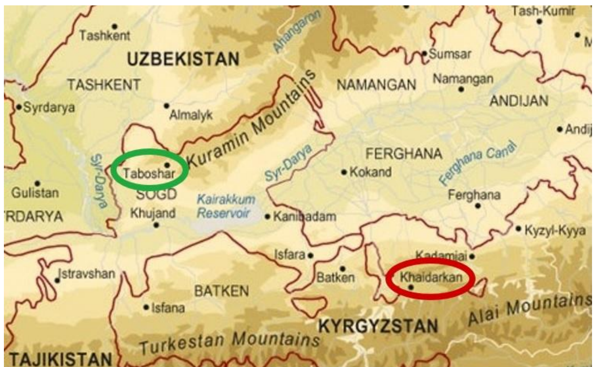
Emplacement des deux villes minières

La ville de Tabochar fut, quant à elle, fondée en 1936 sur l'emplacement d'un village éponyme peuplé de Kurama (groupe ouzbékophone vivant dans les montagnes du même nom dans la partie occidentale de la vallée du Ferghana) à proximité d'un gisement d'uranium. Du fait de l'utilisation militaire de l'uranium, la ville et la mine furent rattachées au ministère de la Défense et des Services de sécurité (NKVD). Là aussi, la population autochtone ouzbèke s'est rapidement retrouvée en minorité avec l'afflux de Tadjiks venus des villages environnants et d'ingénieurs et cadres européens (Russes et Ukrainiens). A partir de 1943, la ville fut un camp de travail pour les prisonniers de guerre allemands qui contribuèrent à l'exploitation de la mine, mais également à la construction de bâtiments en pierre de taille, une technique totalement étrangère à la région (voir photos en annexe).