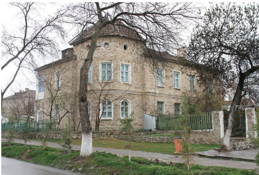
Habitation en pierres de taille