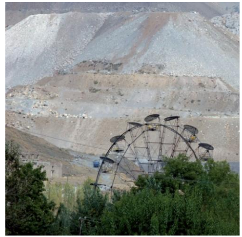
Vue des terrils depuis la ville