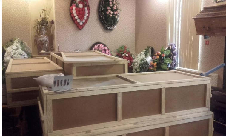
Figure 1 – Les caissons de bois utilisés pour les transports posthumes

Au terminal de fret, les cercueils sont encore appelés, comme du temps de la guerre soviétique en Afghanistan, les Gruz 200 – les « Marchandises/Cargaisons 200 » – le nombre faisant référence au poids moyen calculé par les compagnies aériennes, à la fois dans un souci de facturation et d'équilibrage des soutes d'avion. Notons ici que la compagnie nationale tadjike, Tajik Air, transporte les corps gratuitement depuis plusieurs années, mais ne peut charger plus de trois ou quatre cercueils à la fois, ce qui implique une organisation du transport par les pompes funèbres en amont. Les autres compagnies aériennes facturent le retour soit au poids du fret (calculé sur la base moyenne de 200kg), soit de façon forfaitaire. À titre d'exemple, la compagnie nationale Uzbekistan Airways facture 11 000 roubles 10 le transport d'un Gruz 200 .