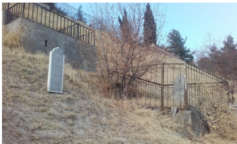
Figure 3 – Le cimetière de Sari Osio à Douchanbé (J. Cleuziou, Tadjikistan 2017)

Par la suite, la circulation des cadeaux qui a lieu pour toute cérémonie au Tadjikistan demeure là aussi l'apanage des femmes y compris en contexte funéraire, et reprend comme à son habitude à partir du 3 e jour suivant l'inhumation. Avant le 3 e jour, le sens des dons est inversé puisqu'en principe c'est la communauté (les proches, les voisins immédiats) qui prend en charge la famille du défunt en lui apportant nourriture et soutien moral (la famille se doit de ne rien faire).